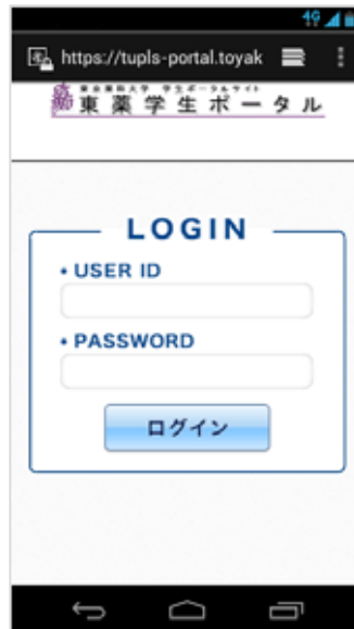
スマートフォン用画面